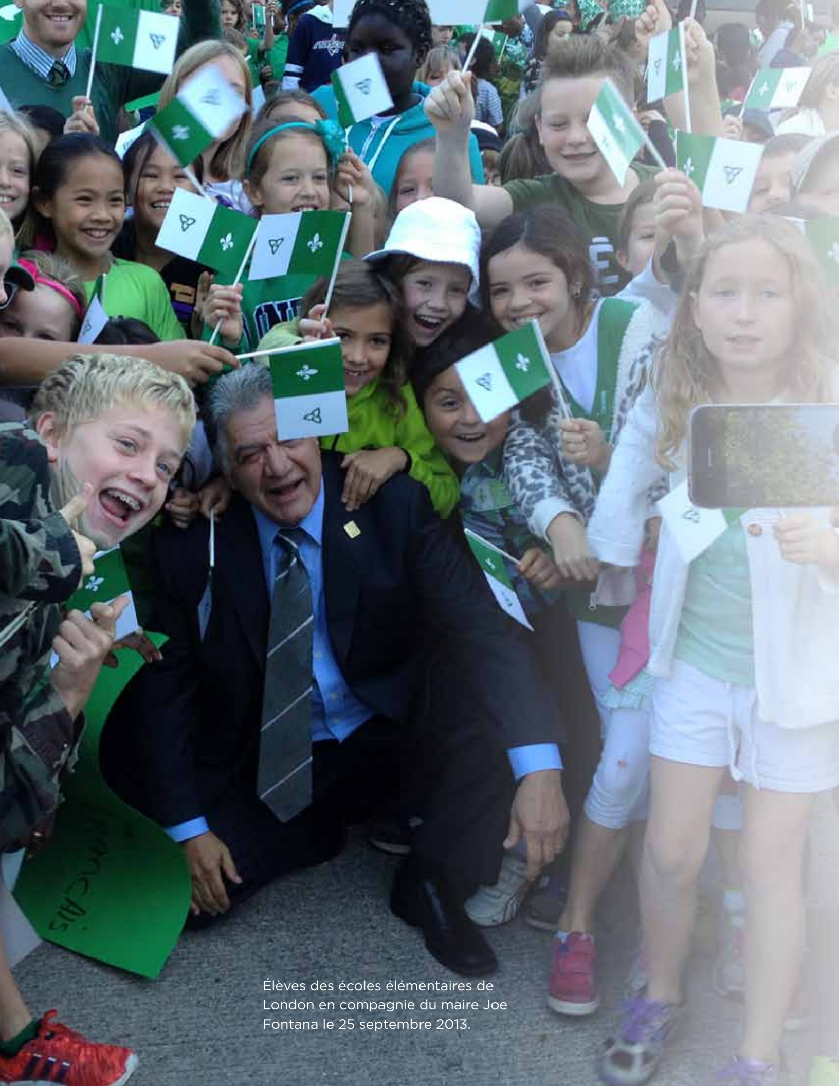
Élèves des écoles élémentaires de London en compagnie du maire Joe Fontana le 25 septembre 2013.