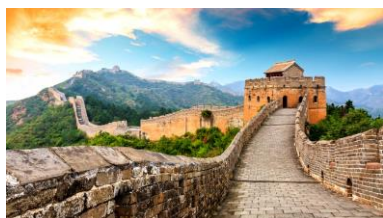
La Grande Muraille de Chine