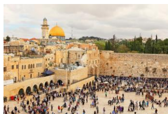
Le Mur des Lamentations, Jérusalem