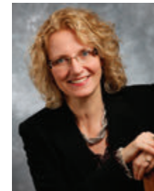
Sylvie Longo Surintendante de l'éducation