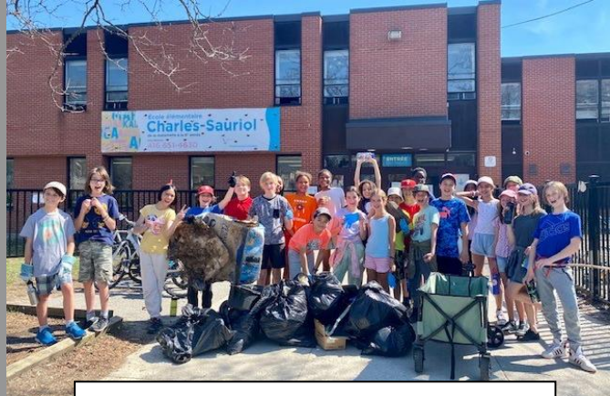
Le grand nettoyage communautaire du 14 avril 2023