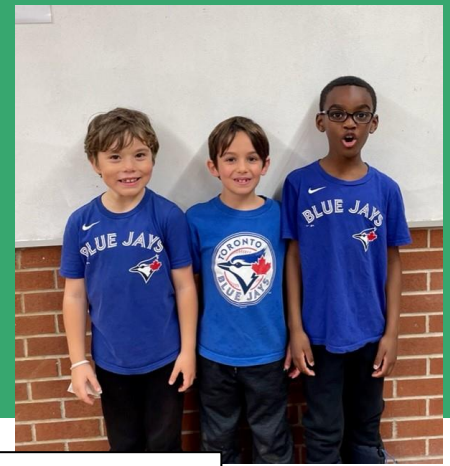
Journée jumeaux - jumelles