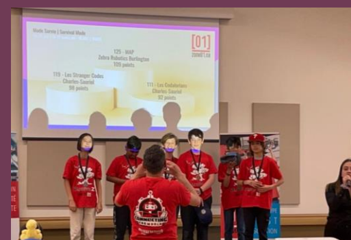
Intro Planète Z - Mode survie