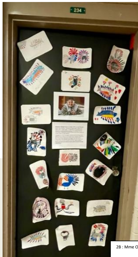
2B : Mme Olfa