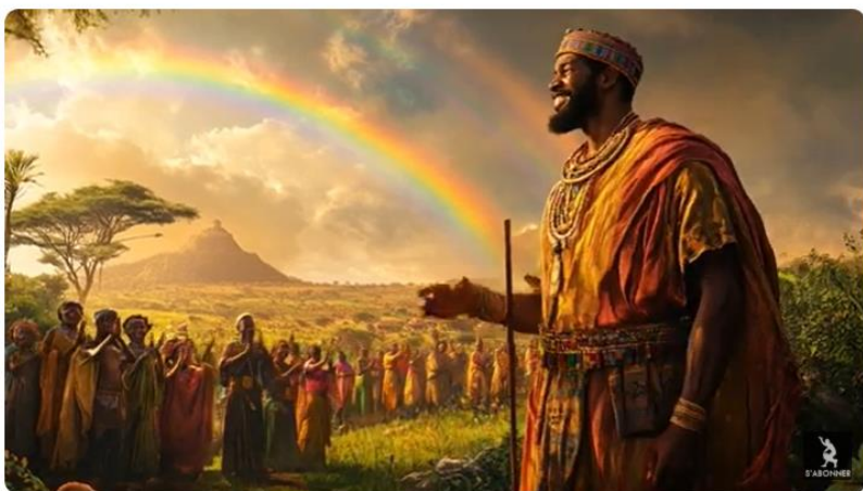
LE TAMBOUR DU ROI (Conte Africain -Afrofantasy)