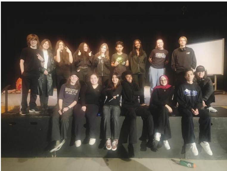
Le conseil des élèves 2023-2024, Les Flammes, a rassemblé tous les élèves de l'école pour l'assemblée général.

À Étienne-Brûlé, les journées sont remplies d'activités intéressantes. Les sorties scolaires permettent aux élèves de vivre des expériences enrichissantes à l'extérieur de l'école. Voici quelques photos des activités de cette semaine.