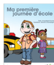
Lire et compter