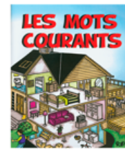
Enrichir son vocabulaire