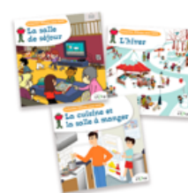
Albums sans texte pour développer le langage