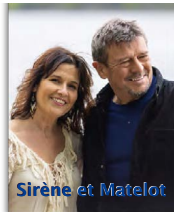
Sirène et Matelot