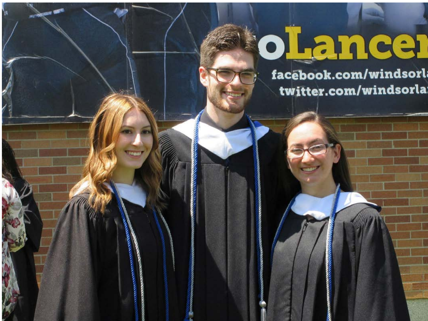
Diplômé•e•s du baccalauréat en science politique "Honours" avec la spécialisation française