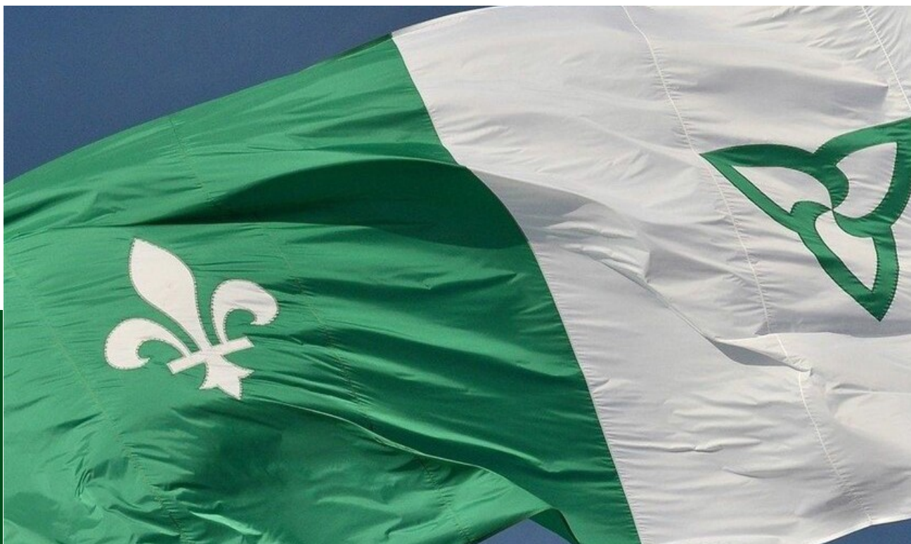
Le drapeau franco-ontarie