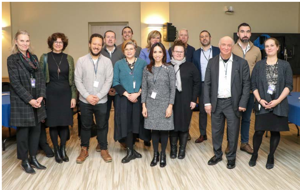
Participant•e•s de Connaissez vos droits ! Un symposium communautaire sur la Charte en mars 2023