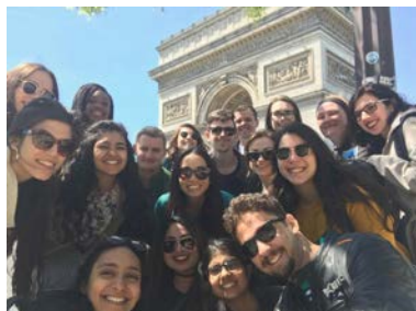
Séjour d'une journée à Paris, EU Study Abroad Program