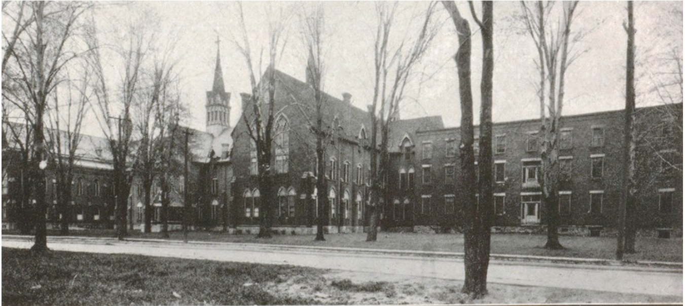
Collège de l'Assomption