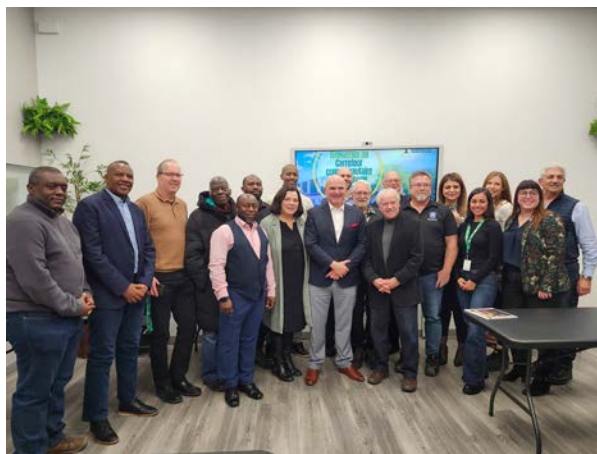
Ministre de l'Emploi, du Développement de la main-d'œuvre et des Langues officielles au Carrefour Francophone à Windsor le 24 janvier 2024.